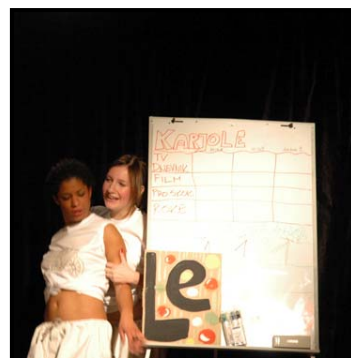
Maja Hostnik

Nadaljevanje sledi 1. decembra 2007, ko se bodo v improvizaciji v Mladinskem centru Velenje pomerili Zelene pink ponk žogice in predstavniki Gledališča Velenje, 30 in +.